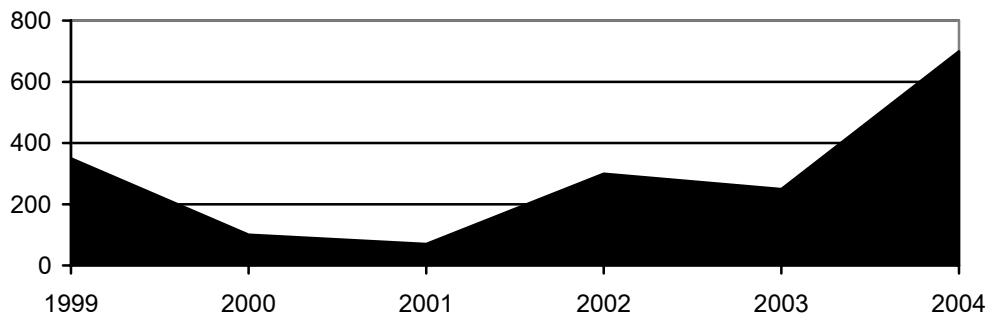
■ ՌԴ պետանվտանգության մարմիններին հատկացված գումարի չափը (մլրդ ռուբլի)